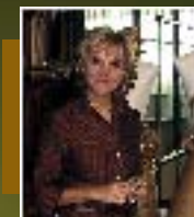
Catycris (tendas de moda)